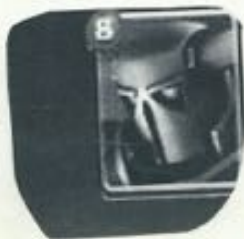
Arena 5 + P.E.K.K.A

Der p.e.k.k.a ist ein Roboter, der aus dem Spiel clash royale kommt. Das Spiel clash royale ist eine App, die man kostenlos im App Store oder im Google Play herunter laden kann. Man kann mit Freunden spielen oder in Clan mit seinen Freunden spielen!!!!!!!;:))