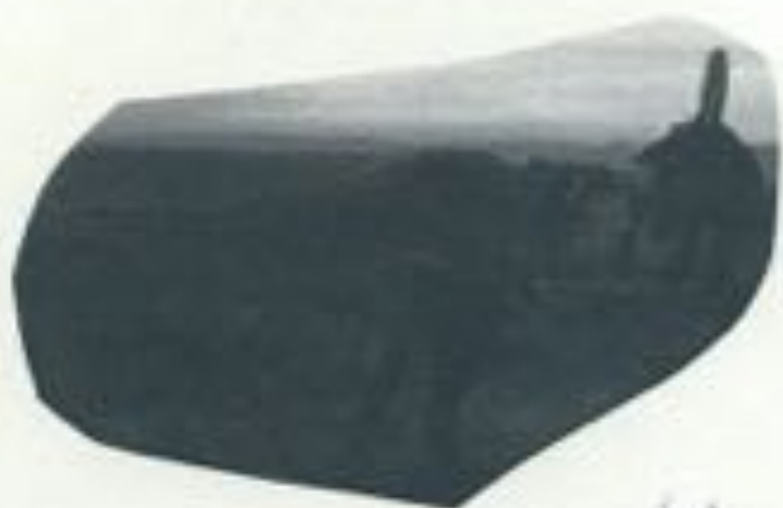
Spinosaurus vs Tyrannosaurus